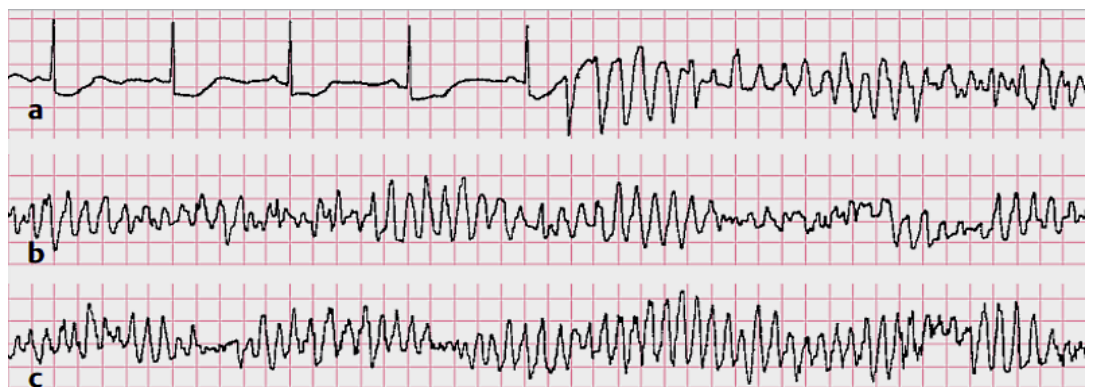
Torsade de pointes hier zuerst Zeichen schwerer Myokardischämie, dann sog. R-auf-T-Phänomen, anschl. Mischung kammertachykarder und kammerflatternähnlicher QRS-Konfigurationen